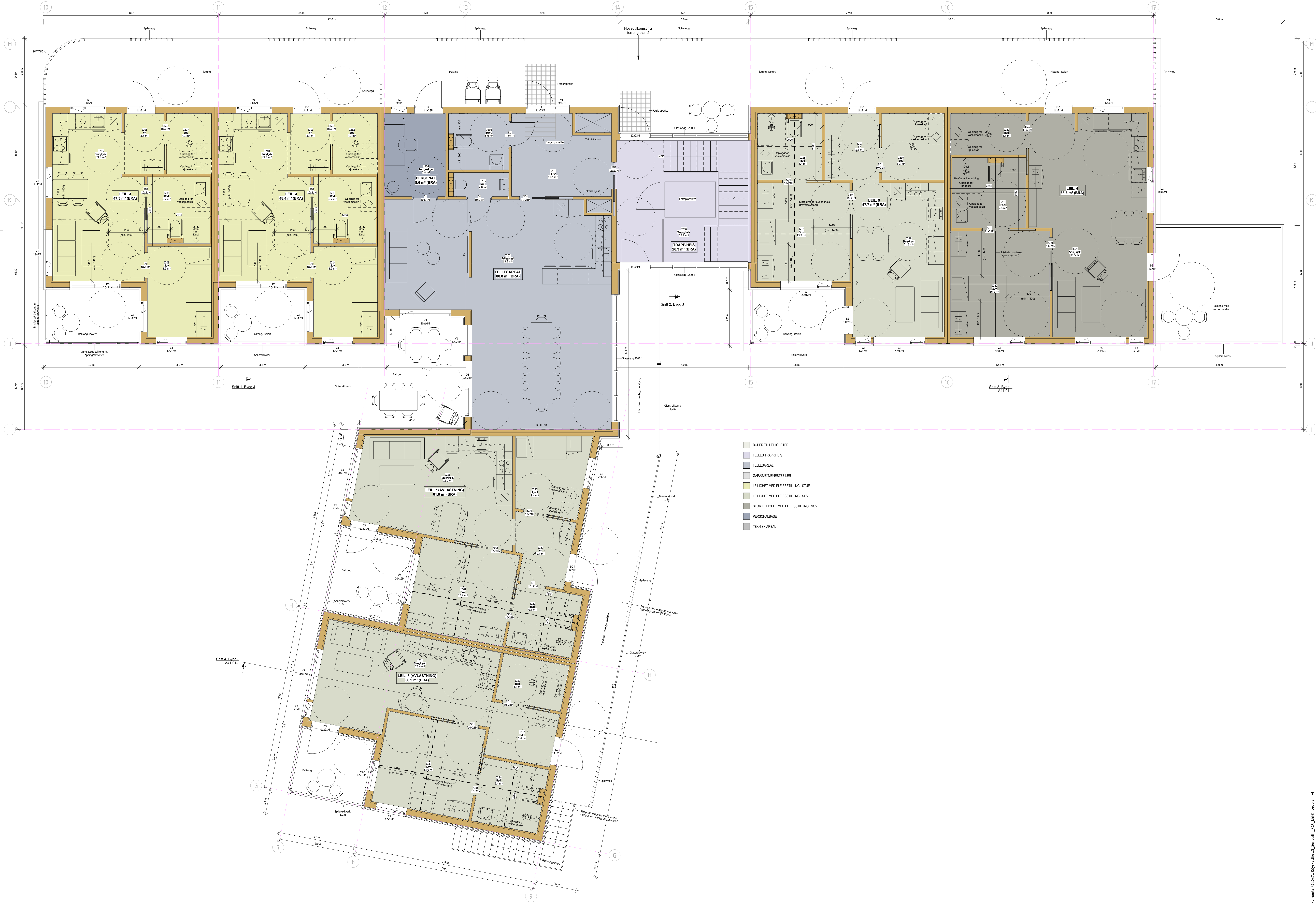
Plan 2, Bygg J

Revisjon Revisjonsdato Rev. av Rev. dato